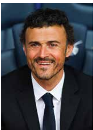
مدیر ورزشی بارسا: انتخاب جانشین انریکه سری است

در همین حال، اندرو لی نماینده پارلمان از حزب کارگر فدرال می گوید آقای