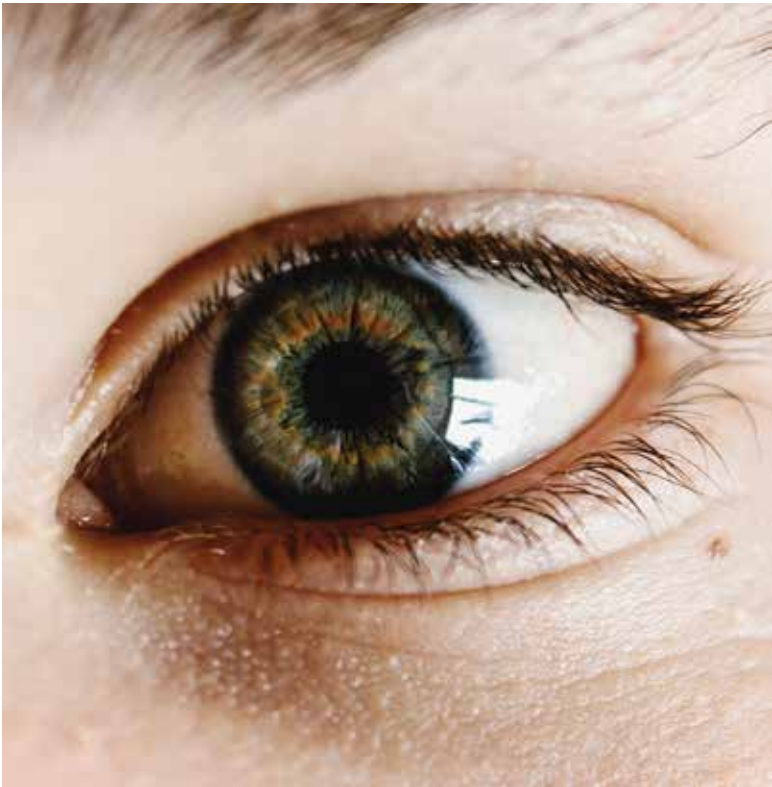
گردآورنده: لادن ذوالقدری