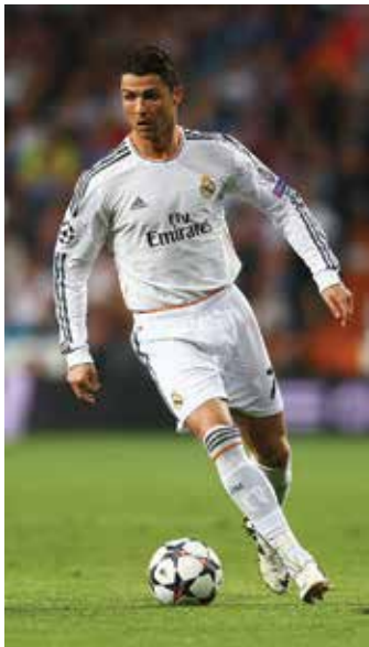
برابری رثال مادرد با رکورد تاریخی بنفیکا

در دقایق پایانی اتفاق خاصی رخ نداد و بازی با برتری ۵-۱ بایرن به پایان رسید.