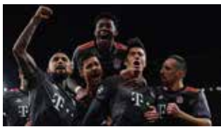
شاهکار دیگری از پروفیسور آرسانال ۱-۵ بایرن؛ تکرار کابوسی

نیمه دوم را رثال عالی آغاز کرد و در فاصله ۶ دقیقه، دو بار روی دو ضربه کرنر به گل رسید. ابتدا در دقیقه ۵۱، روی ارسال تونی کروس از سمت راست دروازه ناپولی، سرخیو راموس با یک ضربه سر دیدنی، کار را تمام کرد.